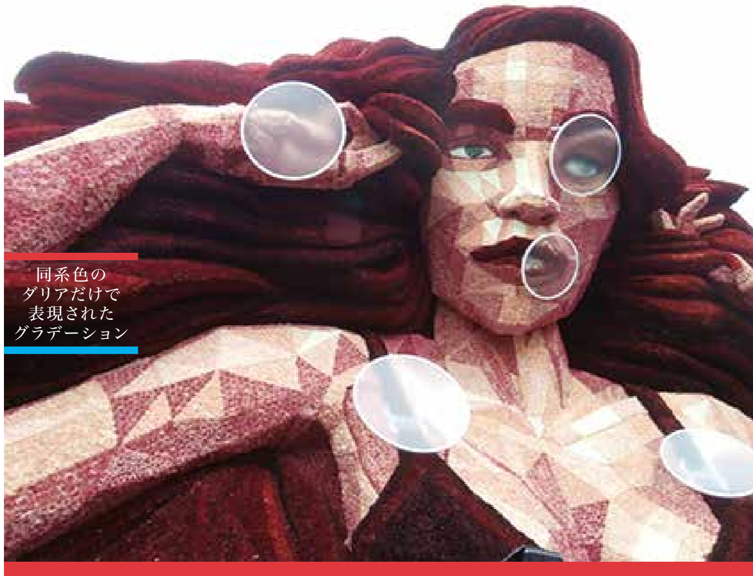
同系色の ダリアだけで 表現された グラデーション

の時期に行われるパレード の飾りつけに使われるよう になり、写真上や下のよう な多種多様な山車が生ま れた。写真中はズンデルト のダリアの展示圃場。